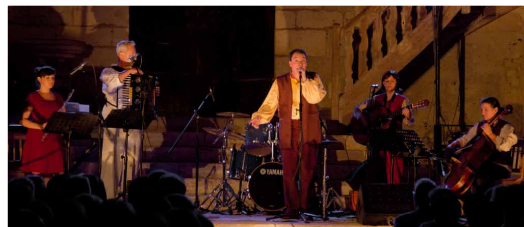
Flûte traversière, guitare, viole de gambe...