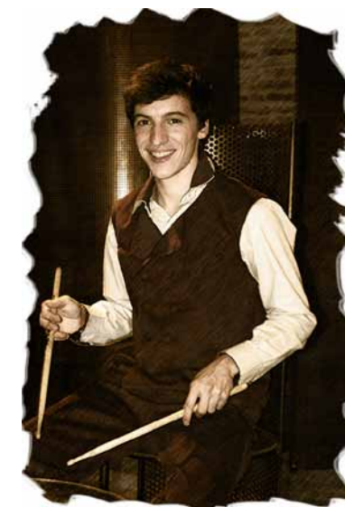
Batterie et Percussions