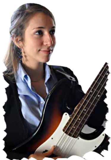
Guitares et voix